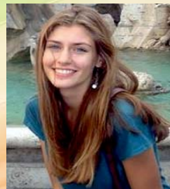
Κύτσια Ζωή Χημείας Θεσσαλονίκης 18.020 μόρια εισήχθη 12η