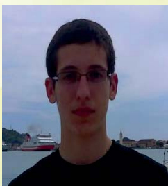
Βλάσσης Παναγιώτης Πληροφορικής και Τηλεπικοινωνιών Αθήνας 18.332 μόρια