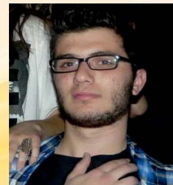
Μαντούκος (Σ)τέλιος Πολιτικών Μηχανικών Πάτρας 17.074 μόρια

...Γιατί η επιτυχία ...είναι θέμα ΕΠΙΛΟΓΗΣ