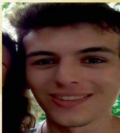
Φιλιππαίος Σωτήριος Επιστ. Φυτικής Παραγωγής Γεωπ. παν. Αθήνας 17.517 μόρια εισήχθη 9ος